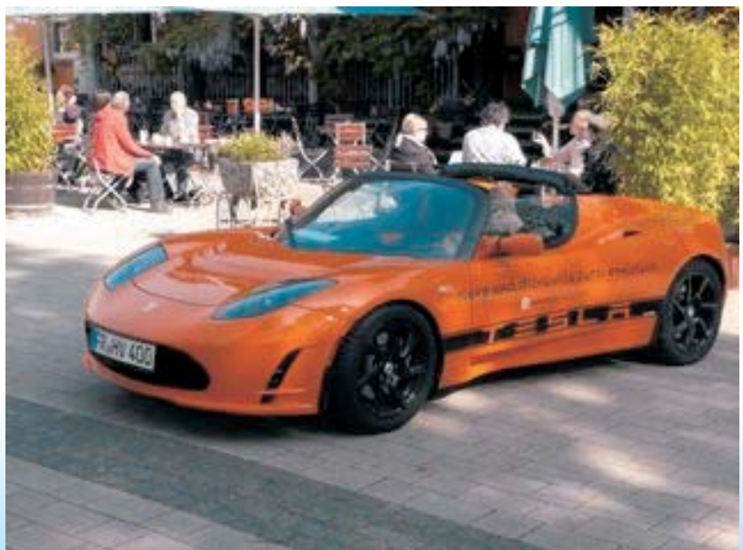
Der Tesla ist für schlappe 100.000 zu haben