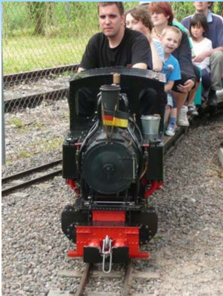
Dieser Zug macht deutlich weniger Lärm...

weiß, ob das tatsächlich so sein wird. Schon gar nicht macht die Deutsche Bahn eine entsprechende Zusage, auch nicht darüber, wann das sein wird, ob in 12, 15 oder erst in 20 Jahren. Das ist