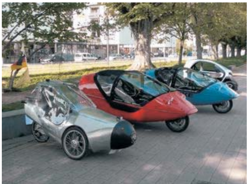
Ein Eigenbau in Flugzeug-Leichtbauweise vor Serienmodellen

einem Mini-Elektroauto einen Stellplatz in einer Quartiersgarage ggf. halbieren? Gilt, wer ein Elektromobil nutzt, trotzdem als autofrei? Diese Fragen hatten wir an den 'Verein für autofreies Wohnen' gestellt, aber wie im Einzelnen bei Elektromobilen zu verfahren ist, kann der Verein momentan noch nicht beantworten – das Thema war bislang nicht akut. Der Autofrei-Verein will sich aber sachkundig machen. Das info-vauban wird darüber berichten, sobald Neuigkeiten vorliegen.