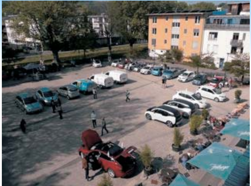
Die E-Mobile präsentieren sich auf dem Marktplatz

nicht anzusehen. Aufgerufen hatten die fesa e.V. und der VDE Südbaden (Verband der Elektrotechnik). Die Route führte von Vauban quer durch die Stadt zum Messegelände, wo die GETEC 2014 stattfand. Das Interesse der Bewohnerschaft in Vauban war leider recht mäßig, obwohl es doch um ein Thema ging, das ureigenst zum Umweltstadtteil zu passen schien. Jene die kamen, konnten die ganze Palette von E-Mobilen unter die Lupe nehmen: E-Bikes, E-Roller, Segways, Twikes, ein Eigenbau, Miniautos bis hin zur großen Tesla-Limousine und-Cabrio. Einzelne wurden auch eingeladen, spontan zur Messe mitzufahren. Um 11:30 Uhr setzte sich der Fahrzeugkorso im Flüsterton in Bewegung, angeführt von einem Polizeifahrzeug, welches allerdings recht komplementär zur Demo-Philosophie mit Benzinmotor betrieben wurde.