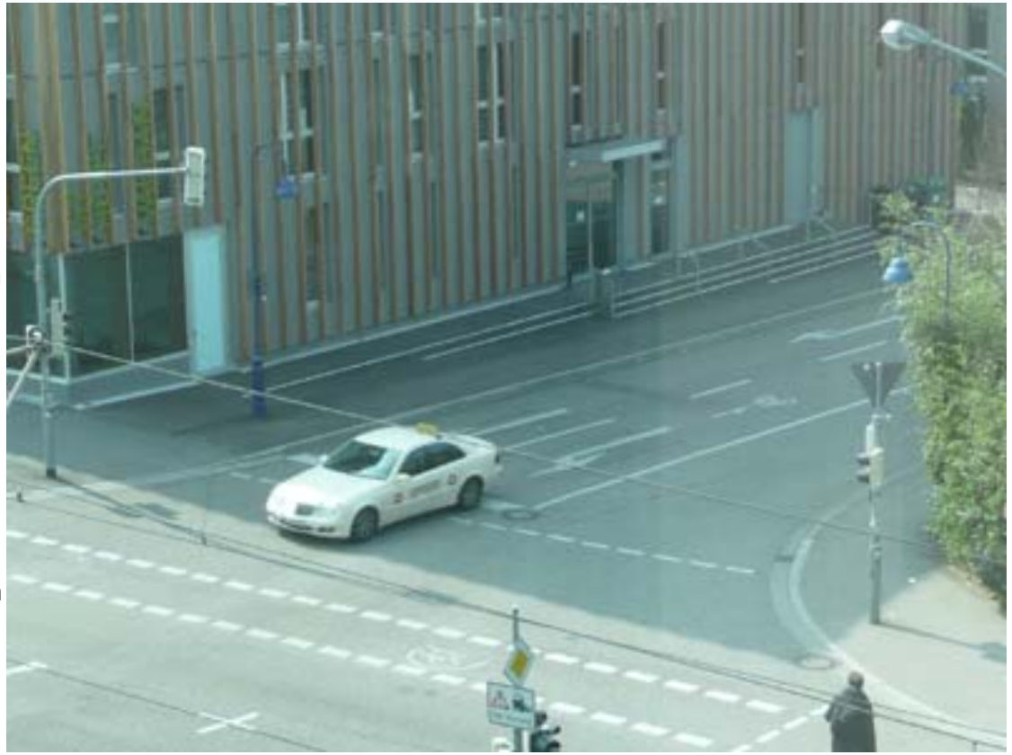
Hier sind Autos klar im Vorteil gegenüber dem Radverkehr

Wer sich bei Rot an der Ampel an der Vaubanallee mit dem Rad aufstellt, muß sich häufig hinter dem stinkenden Auspuff eines Autos einreihen. Bei Grün kommt es dann auch noch vor, daß rechts und links der motorisierte Verkehr überholt, was bei den Radlern durchaus ein Gefühl der Unsicherheit auslöst. In der Linksabbiegespur ist ein Fahrradsymbol angebracht, es folgt ein Mini-Geradeaus/Linksabbiegerpfeil und danach kurz vor der Haltelinie ein großer Linksabbiegerpfeil. Der Sinn der Straßenmarkierung erschließt sich den Unkundigen nur schwer. Wer die Örtlichkeit kennt, kann sich zusammenreimen, daß Radler auf die erlaubte Geradeausfahrt durch die Sonnenschiffpassage hingewiesen werden. Eine Bevorrechtigung des Radverkehrs ist mit diesen Markierungen jedoch nicht verbunden.