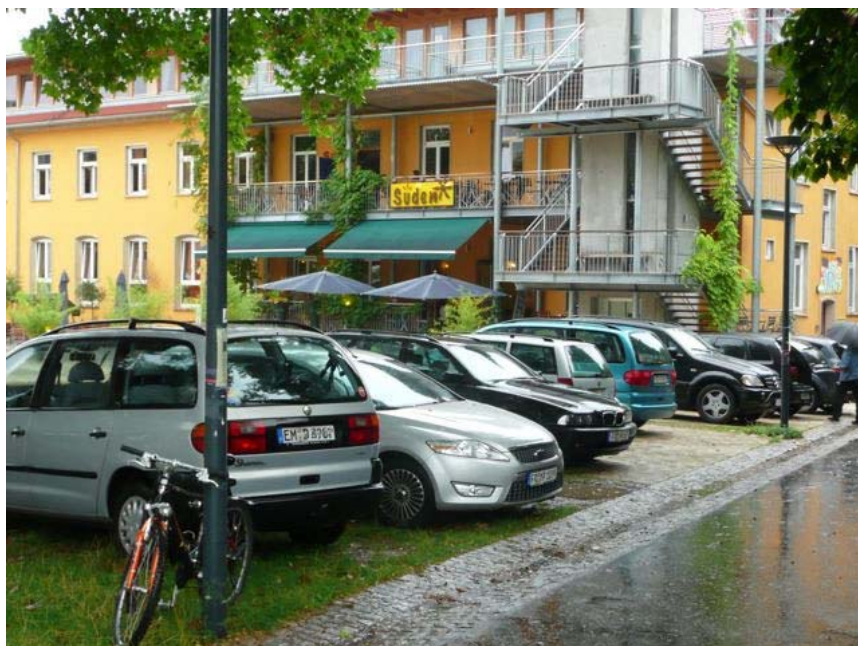
Anlaß für eine kritische Betrachtung des Themas Verkehr?

Beim Thema Verkehr stehen die Punkte sichere Verbindung des Stadtteils mit der Innenstadt/ nach Norden an, speziell für den Radverkehr über die Wiesentalstraße, sowie Möglichkeiten einer Geschwindigkeitreduzierung auf den Hauptzufahrtstraßen im Quartier. Das Thema Wohnen umfasst Fragen zur weiteren Entwicklung