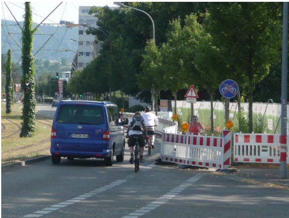
Achtung: Hier werden Radfahrende vom Autoverkehr eingekellt!

Zur bequemerer Bauabwicklung wurde der Baustelle der Gehweg zugeschlagen. Die Fußgänger wurden auf den Radweg umgeleitet. Stellt sich die spannende Frage, was passiert mit dem Fahrrad- und dem Autoverkehr auf dem verbliebenen Straßenraum? Auch wenn die Stadt Freiburg vorgibt, den Radverkehr ernst nehmen zu wollen – hier an der Baustelle wurde wie selbstverständlich so verfahren, daß der Autoverkehr seine Fahrspur behält und den Radfahrenden es ihrer eigenen Kreativität überlassen ist, wie sie sich ihren Weg suchen. Angebote oder hilfreiche Hinweise gibt es keine. Die Folge dieser fehlerhaften Planung kann in vielen brenzigen Situationen beobachtet werden: Radfahrer werden unter Gefährdung an den Rand gedrängt, ja regelrecht eingekellt. Selbst