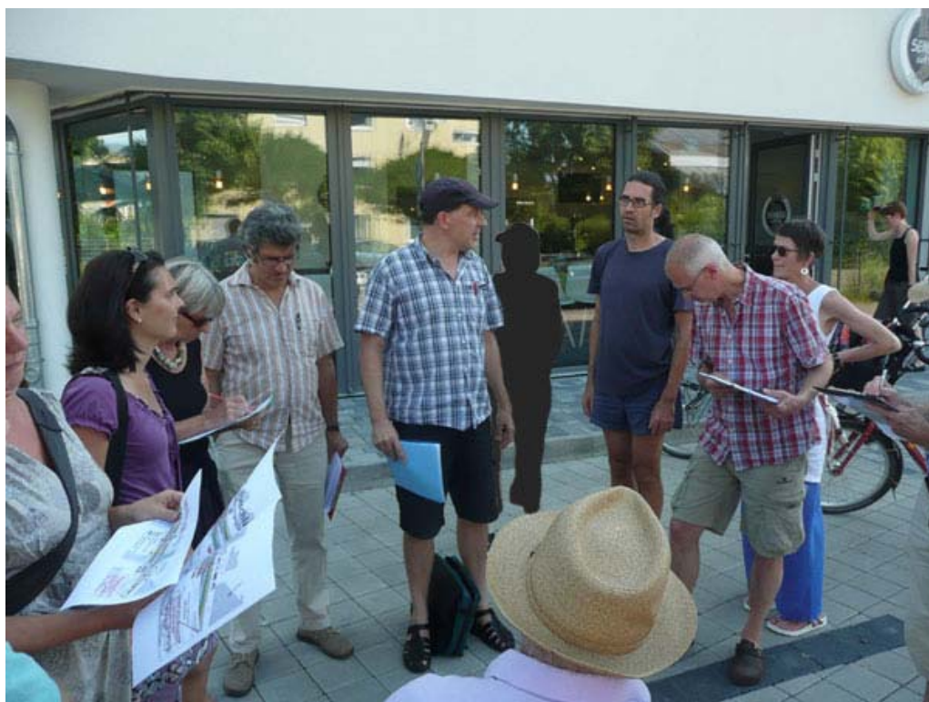
Stauendes Publikum beim Ortstermin zur Radverbindung Vauban:City

Der AK Verkehr hat seit dem letzten Jahr ausführliche Konzepte entwickelt, um verschiedene Verkehrsprobleme in und um Vauban einer Lösung näher zu bringen. Einen besondere Schwerpunkt bildete dabei die Schaffung einer sicheren und zügig zu befahrenden Fahrradverbindung von Vauban in die Innenstadt über Clara-Immerwahr-, Wiesental- und Oltmannsstraße.